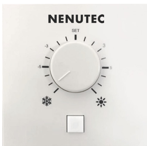
Wygląd urządzenia może odbiegać od przedstawionego na ilustracji. Dane techniczne mogą ulec zmianie.

Zadajnik pomieszczeniowy do inteligentnych siłowników NSVA