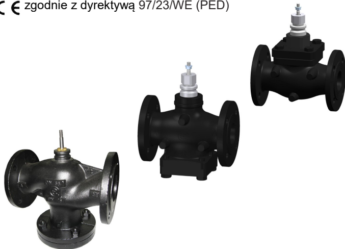
Wygląd urządzenia może odbiegać od przedstawionego na ilustracji. Dane techniczne mogą ulec zmianie.