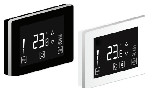
Dotykowe zadajniki pomieszczeniowe